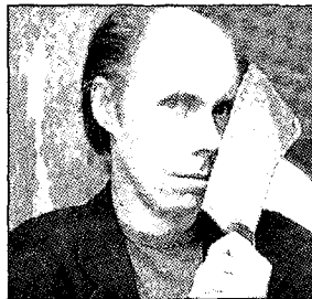
Jeffery Deaver; sopra, una scena del "Collezionista di ossa"

«Sì, il grigio mi manca, perché il grigio, l'ambiguità, è il colore della vita. Ma sono uno scrittore di genere, e il mio è un genere "in bianco e nero": ci sono i buoni, Lincoln Rhyme, Amelia Sachs, ci sono i cattivi, il mago-killer. Il bianco e nero serve a intrattenere, e io sono uno scrittore di intrattenimento. Ma c'è qualcosa di dannatamente bello nel far dimenticare alla gente le sue preoccupazioni, nel farla perdere in una storia. E' un mestiere, so di farlo al meglio».